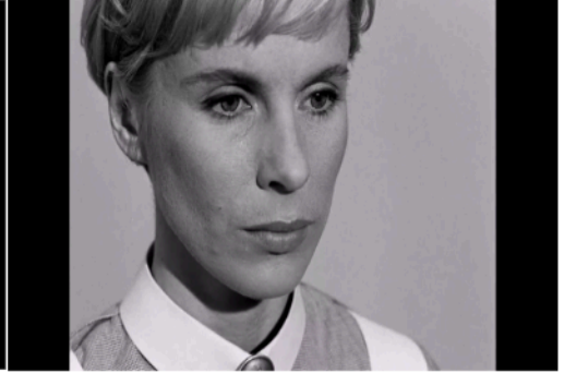
Şekil 5: Alma'nın yüzünün görüntüsü.