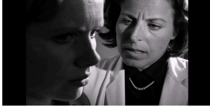
Şekil 7: Doktorun Elizabeth'i anladığını söylediği sahne.

Bütün sorumluluklardan kaçmak isteyen Elizabeth, bu maske sayesinde kendi içine kapanmıştır. Elizabeth, televizyonda izlediği olumsuz görüntüler karşısında kendi gerçekliğini sorgulamaya başlamıştır. Özellikle rahibin yandığı sahne karşısında maskesi ile çatışmaya giren Elizabeth, kendi fantezi dünyasından çıkmak ister. Fakat bu durum çok fazla sürmez. Elizabeth, önce gerçeklik ile yüzleşir sonra tekrar personasına geri döner. Bu durumda yeniden içine kapanır ve kendi sessizliğine bürünür.