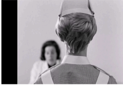
Şekil 4: Alma'nın arkadan görünüşü.