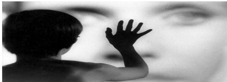
Şekil 1: Küçük çocuğun annesinin yüzüne buğulu camdan bakması.

Bergman’ın anılarında annesine duyduğu hayranlık ve onun çekiciliğine kapılması, içinde yaşadığı Oedipus karmaşasından kaynaklanmaktadır. Psikanalitik açıdan bakıldığında, Persona filminin girişinde kullanılan çocuk görüntüsünün yazarın kendisini resmetme ihtimali oldukça yüksektir.