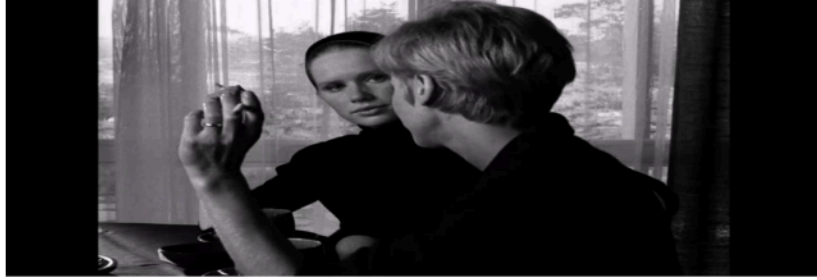
Şekil 9: Elizabeth ve Hemşire Alma'nın aynı tür ve renk elbiseler giydiği sahne.

Bergman sinemasında her ayrıntı önemlidir. Elizabeth ve Hemşire Alma, birlikte vakit geçirirken mutludur. Bergman, karakterlerin elbiselerinde de gece gündüz gibi ayırt edici renkler kullanarak personanın iki yüzünü göstermek istemiştir. Elizabeth beyaz renkli elbiseler giyerken gölgesi durumundaki Hemşire Alma aynı elbiseleri giyer fakat koyu renkleri tercih eder. Bu durum iki karakteri şekil olarak ayırmakta ve birbirlerini anlamalarını sağlamaktadır.