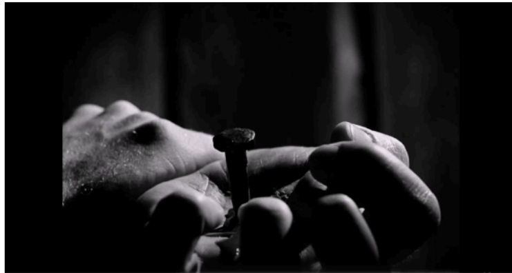
Şekil 2: Çivilenmiş bir el görüntüsü.

Şekil 2’deki çivilenmiş el görüntüsü, Bergman sinemasında iki sembolik durumu ifade etmektedir. Birinci açıdan bakıldığında, Hz. İsa’nın ellerinden çivilenmesine sembolik açıdan bir gönderme vardır. Bergman’ın Büyülü Fener kitabında anlattığı hatıralarını burada kullanmıştır. Hz. İsa’nın günahlarına kefaret olarak ellerinden çivilenmesi, filmde iki karakterin hayatlarını birleştiren çocuk üzerinden verilmiştir. Burada çivi hem günahkârlığı hem de birleştirici özelliği ifade etmektedir. Diğer açıdan bakıldığında iki karakterin aslında aynı kişi olması ve bu kişilikleri birleştiren “ben”in de bu çivi ile sembolize edilmesi ihtimal dâhilindedir. Zira gölge ve persona arasındaki çatışmanın sona ermesi ikisinin bir bütün hâline gelmesine bağlıdır. Yine filmin sonuna doğru Elizabeth ve Alma karakterinin sorunlarını çözüp kişiliklerine dönmesi bununla açıklanabilir.