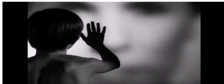
Şekil 18: Bulanık bir kadın yüzünün olduğu sahne.

Şekil 17'de Elizabeth, Hemşire Alma'nın aslında kişiliğini yok etmeye çalışmaktadır. Bergman bu sahnede, Elizabeth'in karanlık tarafından nasıl kurtulduğunu açıklamaya çalışmaktadır. Diğer yandan gerçeklerle yüzleşip karanlık tarafından uzaklaşan Elizabeth, kendi varoluşunu tamamlamaya başlamıştır. Artık Elizabeth, "gölge"den uzaklaşıp eski hâline dönmüştür. Zira filmin sonlarına doğru Elizabeth, sahnede yine Elektra rolünü oynamaktadır.