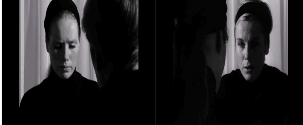
Şekil 14: Elizabeth'in görüldüğü sahne.

Hemşire Alma, Elizabeth'e "Sağlıklı rolü oynuyorsun. Herkes de sana inanıyor. Bir tek ben senin ne kadar çürümüş olduğunu biliyorum." diyerek onun gerçek kişiliğini gördüğünü ifade eder. Karakterlerin kişilikleri bu sahnede yine bir çözülme sürecine girmektedir. Elizabeth'in kocası geldiğinde karşısına Alma çıkar ve bu adam karısıymış gibi onunla konuşur. Hemşire Alma, önce iki kez "Ben Elizabeth değilim." diye reddeder ama adam hiç duymamış gibi konuşmaya devam etmektedir. Elizabeth ise gelip Alma'nın elini adamın yüzüne koyar. Bunun üzerine Alma, adama sarılıp onu sevdiğini söyler. Persona ve benlik bu sahnede tekrar kaynaşma yoluna girmektedir. Elizabeth, cinsellik ve saldırganlık durumunda "gölge"si durumdaki Hemşire Alma'yı kullanmaktadır. Aynı kişilik gibi görünen karakterler, bu sahnede yeniden bütünleşir.