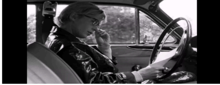
Şekil 11: Hemşire Alma’nın zarfın içindeki mektubu okuduğu sahne.

Hegel’in efendi-köle diyalektiğine göndermede bulunan Bergman, filmin ilk sahnelerinde Hemşire Alma’yı Efendi yaparken Elizabeth ise köle durumundadır. Şekil 10’daki sahnede ise Hemşire Alma köle olurken Elizabeth efendiliğe yükselmiştir. Bu benzerlik aynı zamanda Hemşire Alma’nın gölge arketipinden çıkma eğilimi olarak da değerlendirilebilir. Elizabeth açısından bakıldığında ise persona artık yırtılmak üzeredir. Yine ayna karşısında iki yüzün birbirine benzemesi boşuna değildir. Aynanın insanın diğer yüzü yani ötekini göstermek için tasarlandığı düşünüldüğünde bu durum, persona ve gölge arketipini açık eder.