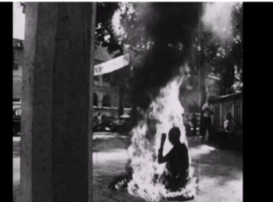
Şekil 7: Rahibin yandığı görüntü.