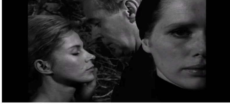
Şekil 13: Hemşire Alma'nın Elizabeth'in kocası ile bulunduğu sahne.

Hemşire Alma, bu sahnede yerde bıraktığı cam kırıklarıyla da kasıtlı olarak Elizabeth'in canını yakmaya çalışmaktadır. Elizabeth'e kendisiyle konuşması için yalvarır, çünkü varlığı ancak bu şekilde kabul görecektir. Ama Elizabeth, konuşmamakta kararlıdır ve Alma öfkelenip Elizabeth'in üstüne kaynar su dökmeye çalışır. Bu durum, bir intihar girişimini olarak düşünülebilir. Ölüme yaklaştığını anlayan Elizabeth "Hayır!" diye bağırır çünkü persona gerçek korku anlarında ortaya çıkmaktadır. Ayrıca gölge durumdaki Hemşire Alma'nın saldırganlığı da ortaya çıkmaktadır.